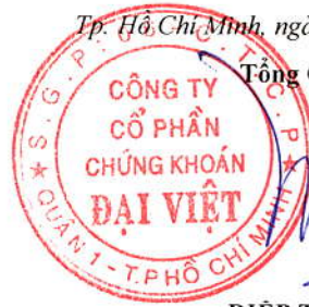
DIỆP TRÍ MINH